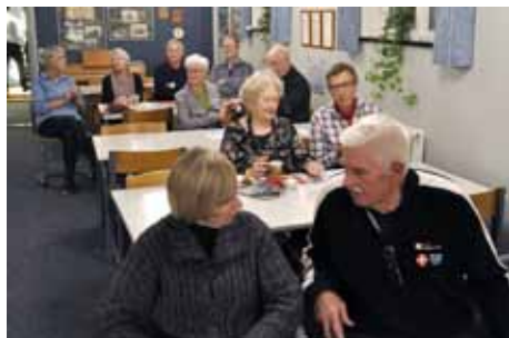
Ordning muss sein. Tysklæreren og Træneren har let ved at blive enige om - livet er ikke til slendrian.