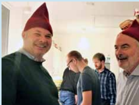
Klubbens topledelse i jule og nytårshumor.

Læs i øvrigt vinterroningsreglementet: https://www.aalborgroklub.dk/wp/vinterreglement/