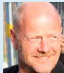
Husforvalter: STEN ZÜLOW