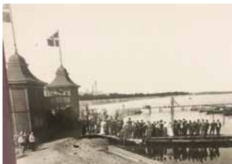
Aalborg Roklubs nye klubhus ved Badehusvej. I baggrunden ses Færchs villa, der lå på Strandvejen, De forenede Tekstilfabrikker. Billedet er taget ved klubbens 25 års jubilæum i 1911.

Alle opkald til og fra klubben bliver logget.