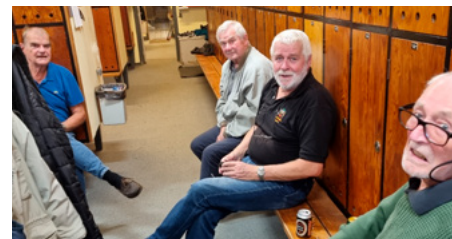
Herrene har fundet plads inde i omklædningen, hvor der både nydes en god snak samt en sjus.

■ at de 'gamle' hygger igen? Trods corona er klubben atter ved at være tilbage i van(d)te rammer. Det ses blandt andet her hvor de gamle atter har indfundet sig til det ugentlige medicintilskud