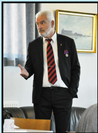
Formanden beretter om det forgangne år

Klubudviklingen går trægt. Men den oprindelige vision står stadig, med mål om 300 aktive roere i 2025.