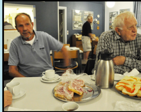
Årets generalforsamling blev på traditionel vis afsluttet med en bid brød og kaffe