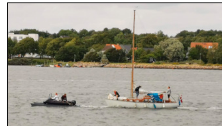
Katamaranen trækker sejlbåden til nærmeste havn i et tempo der ikke var for hæsblæsende for nogen.

Det var en blæsende august-aften i glade lag for universitetsroerne da COVID-19-inducerede restriktioner endelig var lempet tilstrækkeligt til at der igen kunne holdes fest. Indenfor var klubhuset fyldt med feststemte og maskeklædte universitetsroere mens der udenfor på Limfjorden var en ganske anden situation. Der blæste en vældig vind over de oprørte vande, hvilket i sig selv ikke adskilte denne dag fra så mange andre. Men lidt af et scenarie skulle udspille sig på vores fjord da det viser sig at en sejlbåd er kommet i nød. Bådens kølesystem var gået itu med