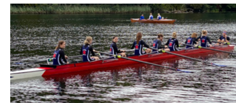
Her ses dame-otteren, der netop har afsluttet deres løb med en tid på 3:50.77

Sorø viste sig fra sin pæne side med flad vand samt lun og tørt vejr. Al træningen og forarbejdet forinden DM resulterede for damerne i en 1K-distancetid på 3:50.77 og herrerne en tid på 3:10.42. Damerne fik et forspring på 30 sekunder før herrerne for at gøre løbet mere ligeværdigt, således der også var lidt at kæmpe for. Damerne blev som nævnt startet med