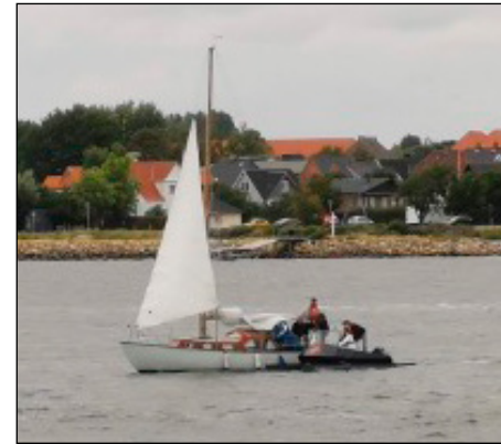
Katamaranen er nået op til de nødstedte sejlere - og bådens mandskab bedes om at bjærge sejlet som det første!