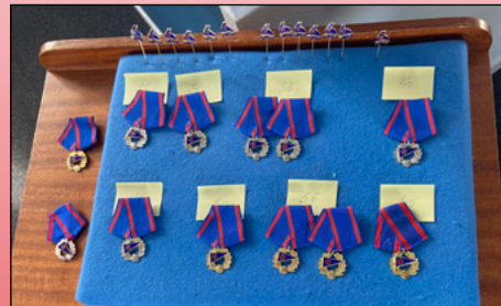
Jubilæumsmedaljer og jubilæumsnåle ligger klar til uddeling