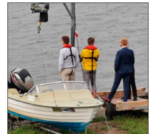
Altanen er ikke det eneste sted at kloge sig. Kanten fungerer heldigvis lige så fint.

Nævnte sejlbåd var ikke den eneste i havsnød! En windsurfer lå i vandet faretruende tæt på kulturbroens piller og lod ikke til at være i stand til at komme ud af situationen på egen hånd. Denne blev dog reddet op af en anden sejler (med fuldt funktionelt udstyr) mens universitetsroerne klargjorde katamaranen. Hele scenariet blev naturligvis observeret af universitetsroerne fra roklubbens altan hvor man er i den bedste position til at kloge sig.