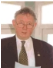
EMNE: Formanden har ordet