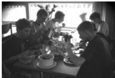
(billede taget under spisning, på Brønderslev Idrætshøjskole 2002)