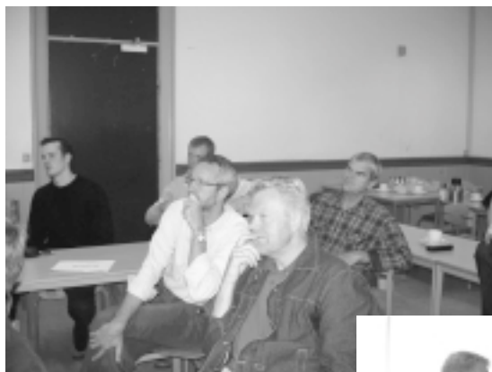
Billeder fra klubudviklingskursus.