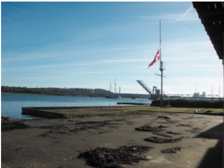
smeden

Formanden har ordet, Nekrolog , Aktivitetskalender, konklusioner fra klubudviklingskursus, Nyt fra bestyrelsen, morgenroernes sæsonafslutning, Oprykning i 8 GP, Spar penge, GAR nyt, Klubkultur og klubånd, Kilometer statistik, Indlæg til roblad, Roblad fornyelse