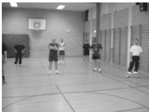
Billeder fra gymnastikken