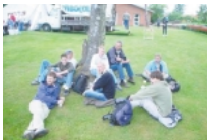
billede fra 8 GP, her ses de gæve roere.