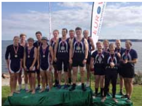
Gruppebillede af medaljetagere.