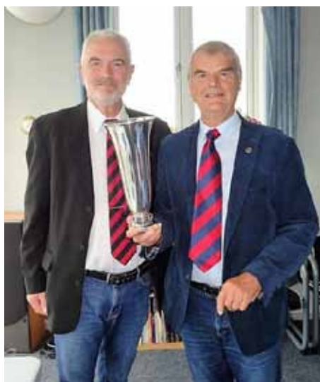
Formand og redaktør fremviser den smukke næsten et kilo tunge 3 tårnede Schølle-Pokal.

lingen. I år blev det så robladets ansvarshavende redaktør, som fik den ærefulde opgave at værne om ”Schøllepokalen” det kommende år. En synlig overrasket redaktør, der ellers ikke er mundlam, fattede sig for en gang skyld i korthed, da han takkede for æren.